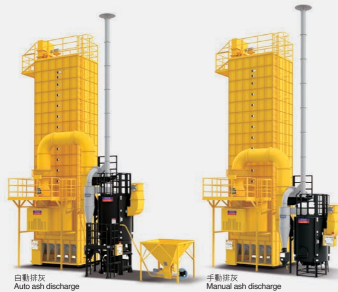
BB-18 with PHS-320B circulating dryer 搭配PHS-320B粗糠型循環式穀物乾燥機