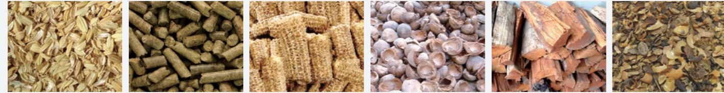
Paddy husk 粗糠 Pressed straw bricks 秸稈壓塊 Corn cob 玉米穗軸 Coconut shell 椰子殼 Wood chip 木材下腳 Coffee hull 咖啡殼