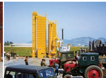
North Korea 北韓