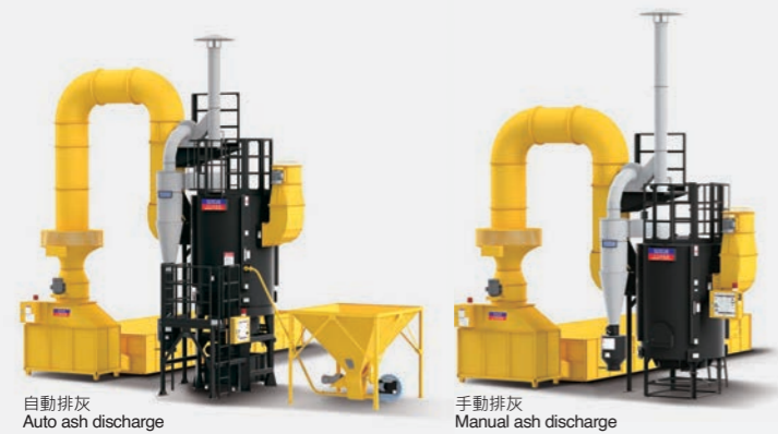
BB-18 with SKS-580B ventilating dryer 搭配SKS-580B粗糠型通風式穀物乾燥機

※ An air-compressor with over 2HP is required. Air-compressor is optional upon order. 需備空壓機2HP以上，空壓機為選配件。