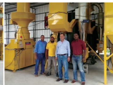
Dominican Republic 多明尼加